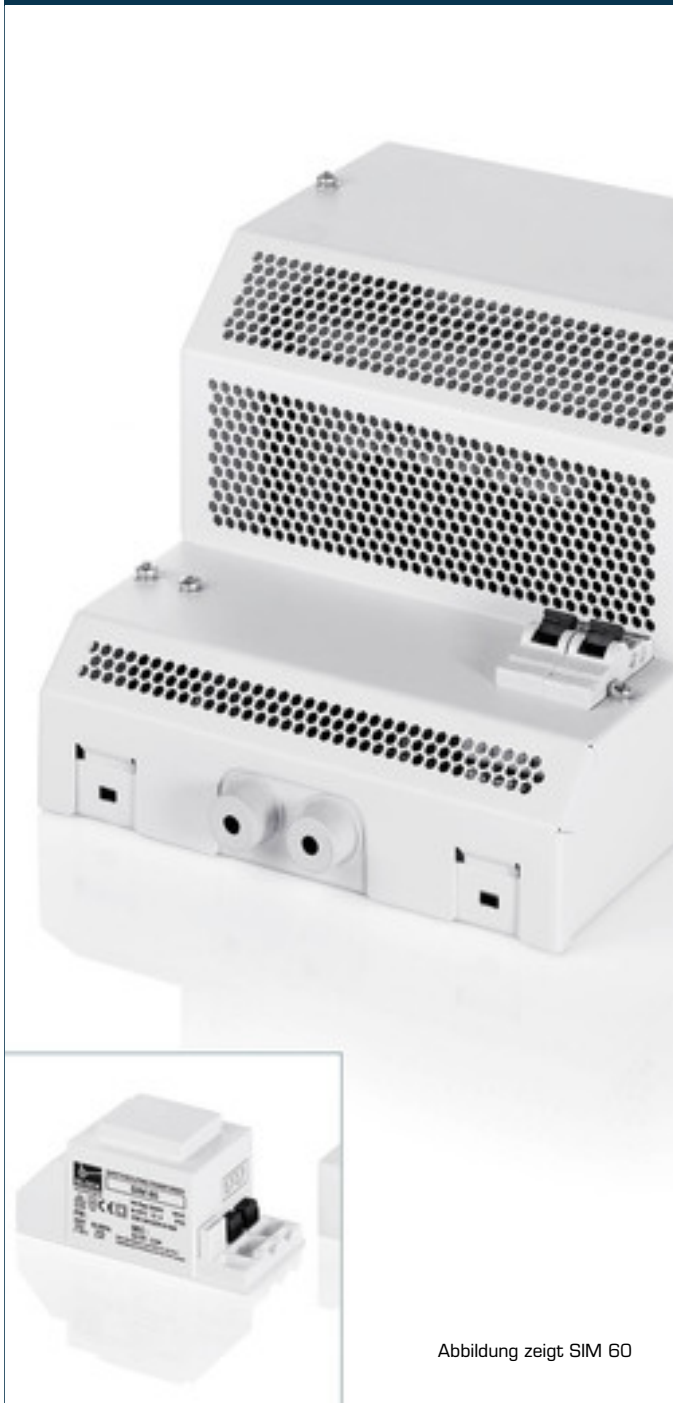
Abbildung zeigt SIM 60