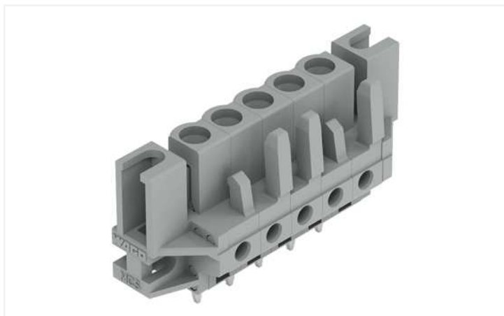
Farbe: ■ grau