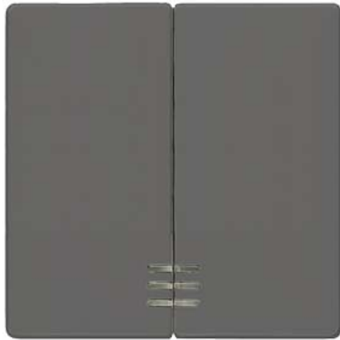
DELTA i-system carbonmetallic Wippe 2-fach mit Fenster 55x55mm