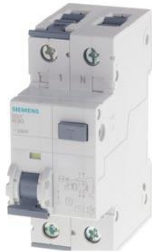
FI/LS-SCHUTZEINRICHTUNG TYP F 30MA, 10KA, 1+N-POLIG, C 16A