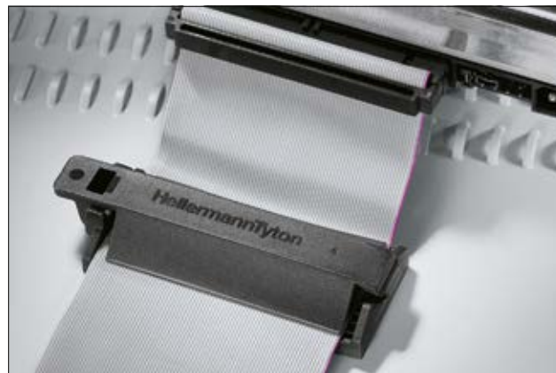
Durch die besonders weichen Flügel wird jedes Flachkabel schonend gehalten.