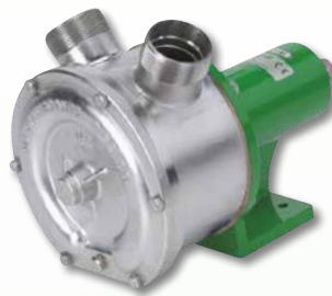
EP Niro für Keilriemenantrieb mit Lagerfuß