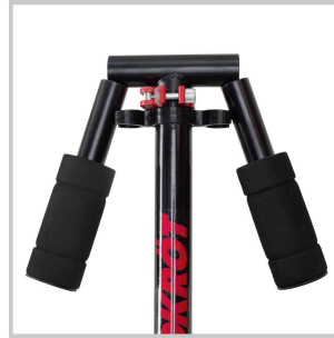
Detail: abklappbarer Lenker