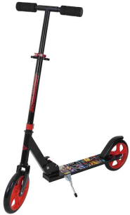
Tretroller City Scooter "Road Catcher Graffiti"

- eignet sich bestens für Kinder ab 1,20 m Körpergröße, Jugendliche und Erwachsene