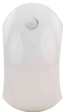
Lampe d'orientation à LED NL25B