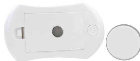
Lampe d'orientation à LED NL25B, avec matériel de fixation