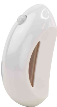
Lampe d'orientation à LED NL25B