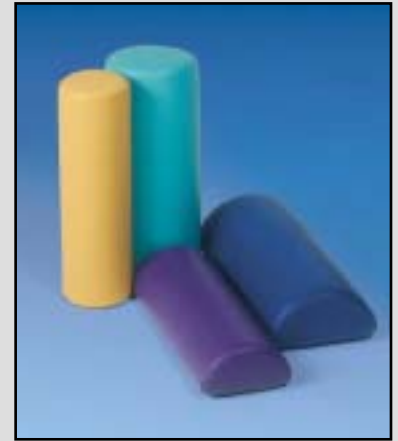
Lagerungsmaterial: Rund- und Halbrollen