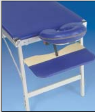
Kopfteil-Version mit U-Kissen zum Einstecken plus Armauflage, stufenlos höhenverstellbar