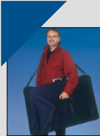
Kofferschutzhülle mit Tragegurt und Haltegriff