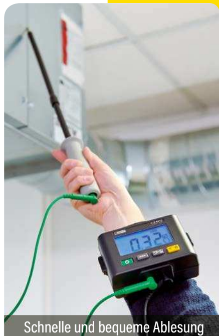
Schnelle und bequeme Ablesung