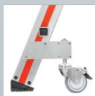
schwenkbare Rolle mit Feststellbremse