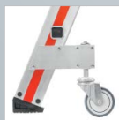
schwenkbare Rolle ohne Feststellbremse