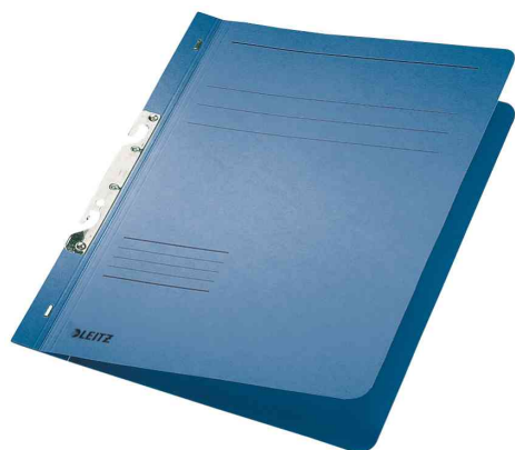
Chemise à crochets, bleu

- s'accroche rapidement dans les dossiers, sans mécanisme d'ouverture