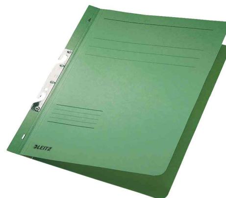
Chemise à crochets, vert