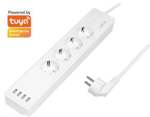
Wi-Fi Smart Steckdosenleiste, 4-fach + 4x USB