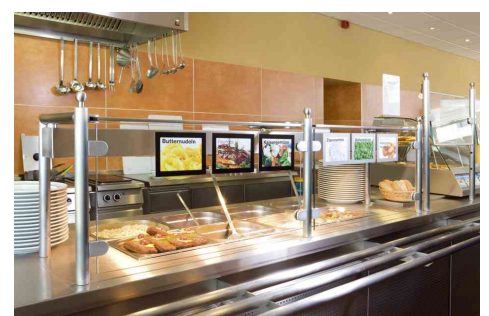
Exemple d'utilisation: pour les cartes de menus