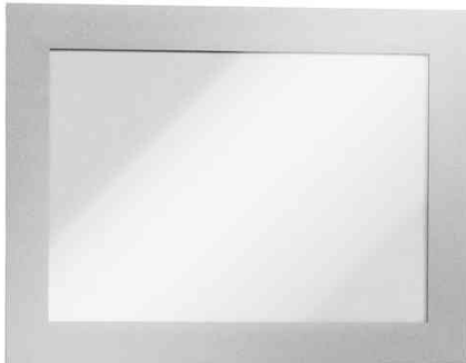
Cadre d'affichage magnétique DURAFRAME, argent