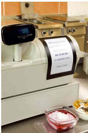
Exemple d'utilisation: pour les offres spéciales