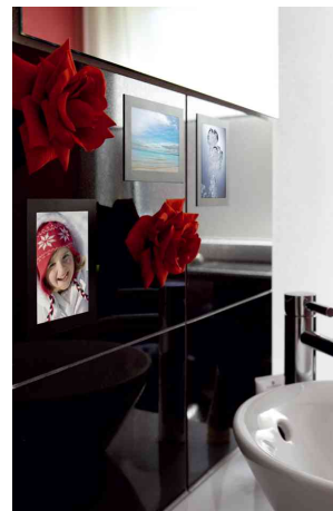
Exemple d'utilisation: pour les photos