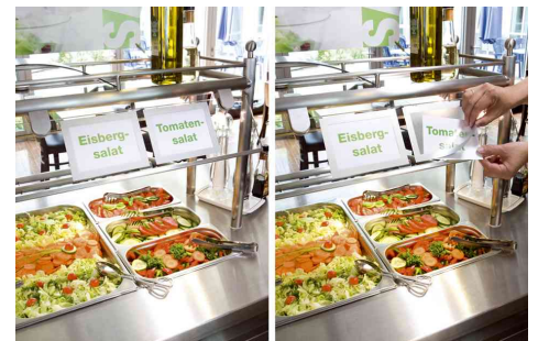
Échange rapide des informations