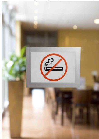
Exemple d'utilisation: comme tableau d'indication