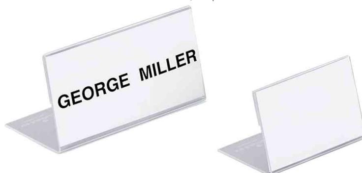
Visuel de référence: Porte-noms en forme L