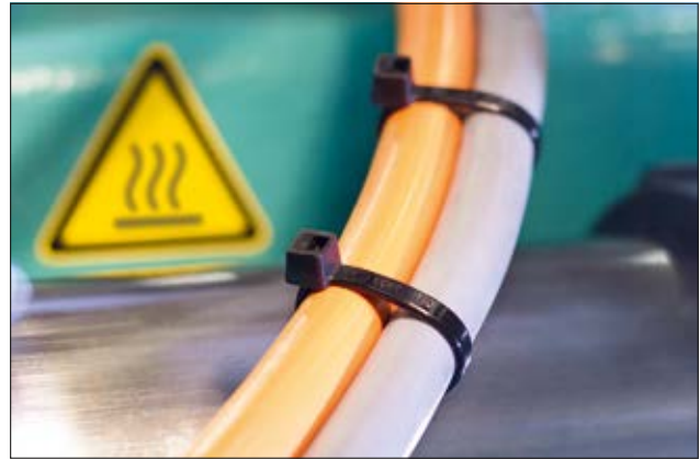
Hitte bestendige bundelbanden uit de T-serie, tot +105 °C (PA66HS).