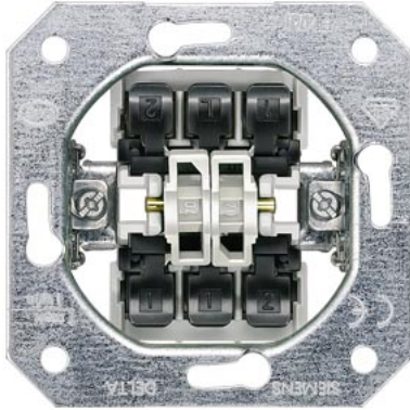
DELTA Geräteinsatz UP Doppel- Wechselschalter 10A 250V