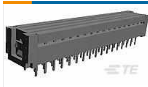
TE Teilnr.:5111595-4 020 ASSY SYS 50 PADDLEBOARD