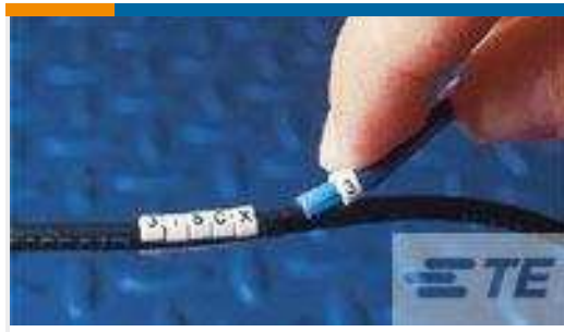
TE Teilnr.:581086-000 STD03W-N