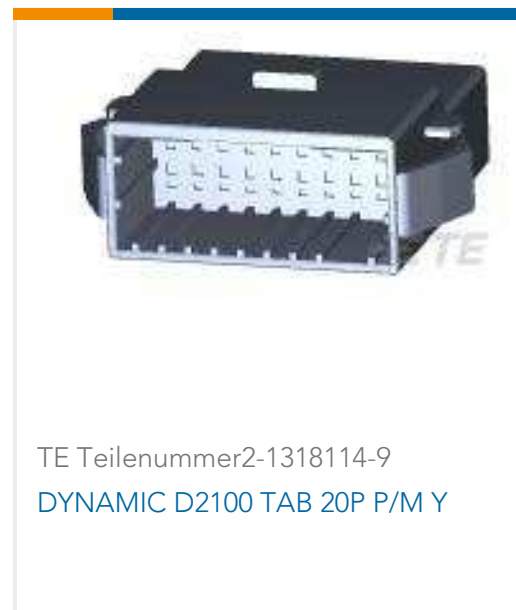
TE Teilenummer2-1318114-9 DYNAMIC D2100 TAB 20P P/M Y