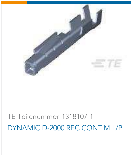
TE Teilenummer 1318107-1 DYNAMIC D-2000 REC CONT M L/P