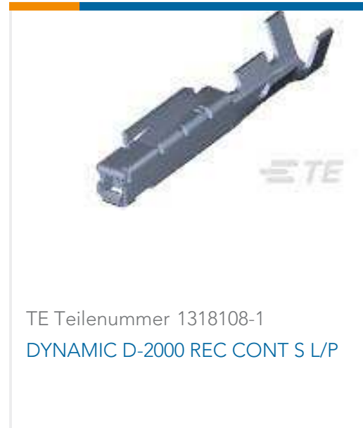
TE Teilenummer 1318108-1 DYNAMIC D-2000 REC CONT S L/P