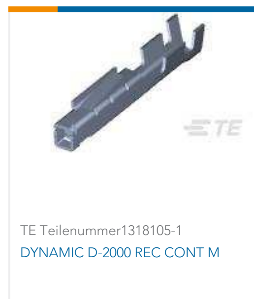
TE Teilenummer1318105-1 DYNAMIC D-2000 REC CONT M