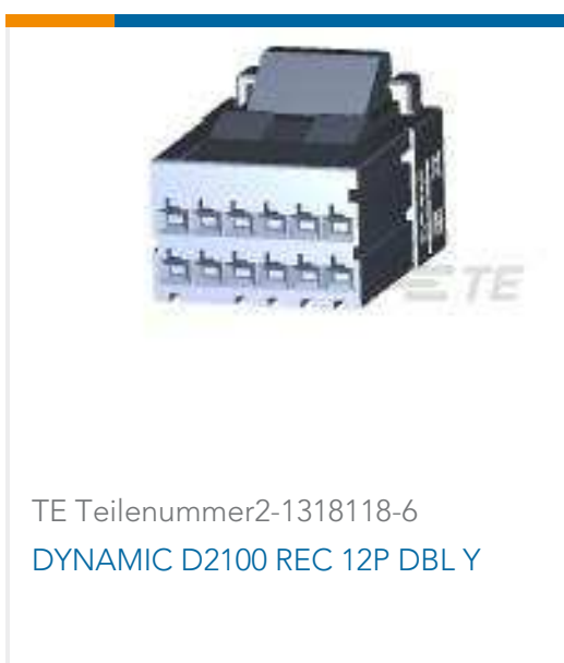
TE Teilenummer2-1318118-6 DYNAMIC D2100 REC 12P DBL Y