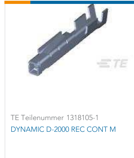
TE Teilenummer 1318105-1 DYNAMIC D-2000 REC CONT M