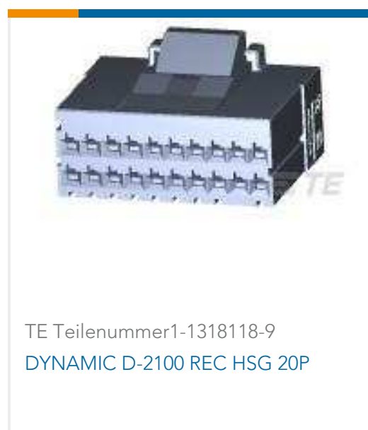
TE Teilenummer1-1318118-9 DYNAMIC D-2100 REC HSG 20P