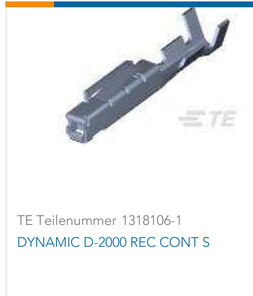
TE Teilenummer 1318106-1 DYNAMIC D-2000 REC CONT S