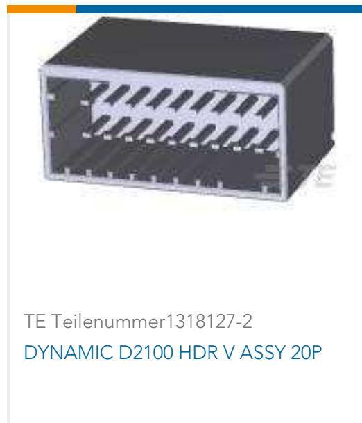
TE Teilenummer1318127-2 DYNAMIC D2100 HDR V ASSY 20P