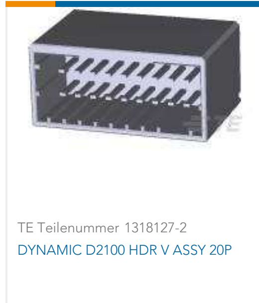
TE Teilenummer 1318127-2 DYNAMIC D2100 HDR V ASSY 20P