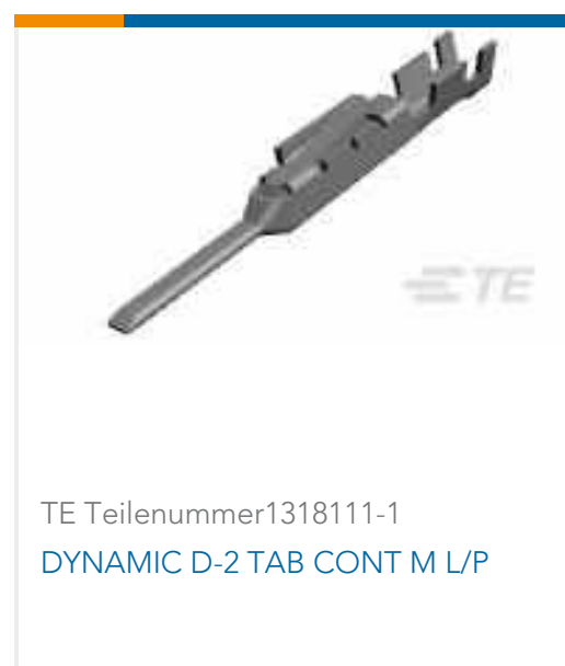
TE Teilenummer1318111-1 DYNAMIC D-2 TAB CONT M L/P