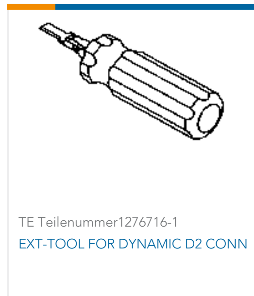
TE Teilenummer1276716-1 EXT-TOOL FOR DYNAMIC D2 CONN