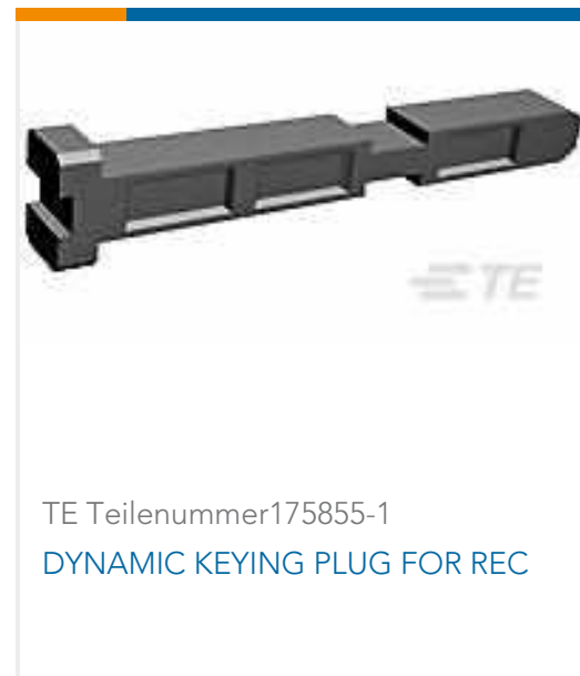
TE Teilenummer175855-1 DYNAMIC KEYING PLUG FOR REC