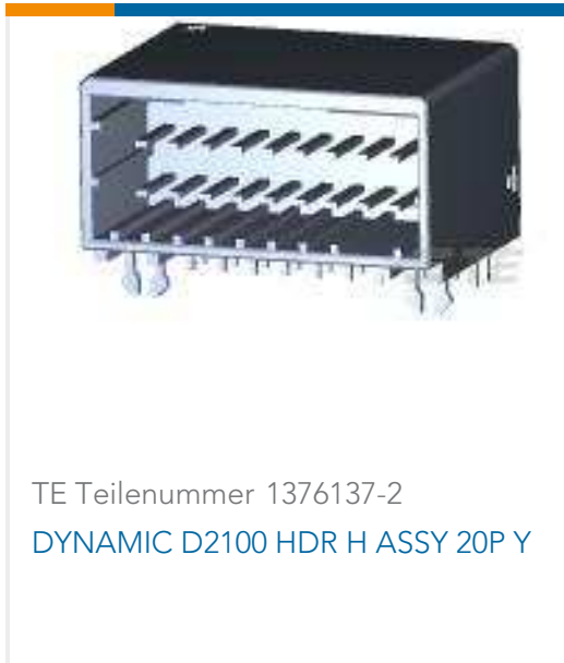
TE Teilenummer 1376137-2 DYNAMIC D2100 HDR H ASSY 20P Y