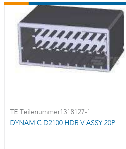
TE Teilenummer1318127-1 DYNAMIC D2100 HDR V ASSY 20P