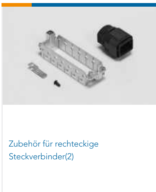
Zubehör für rechteckige Steckverbinder(2)