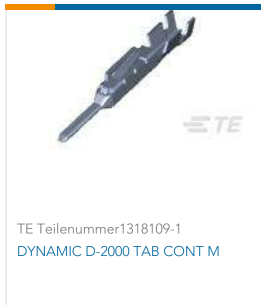
TE Teilenummer1318109-1 DYNAMIC D-2000 TAB CONT M