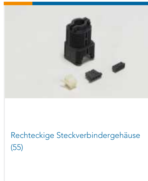
Rechteckige Steckverbindergehäuse (55)