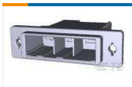
TE Teilenummer1-353047-3 DYNAMIC D-5200S TAB HSG 3P K/X