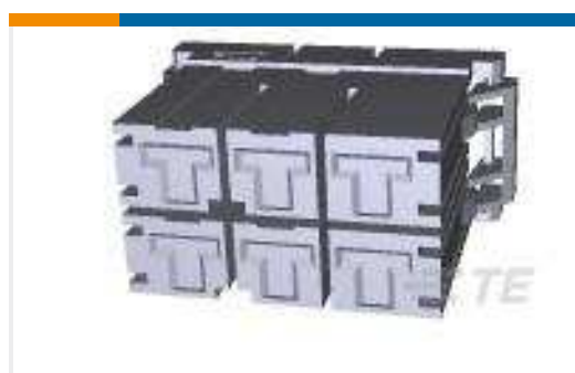
TE Teilenummer1-917807-3 DYNAMIC D-5200M REC HSG 6P X-X