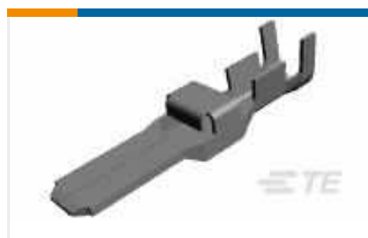
TE Teilenummer917805-2 DYNAMIC D-5 TAB CONT. M L/P