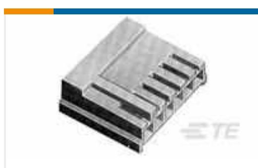
TE Teilenummer171822-6 EIS REC. HSG 6P-NATURAL