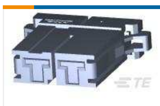
TE Teilenummer1-179958-2 DYNAMIC D-5200S REC HSG 2P K/X