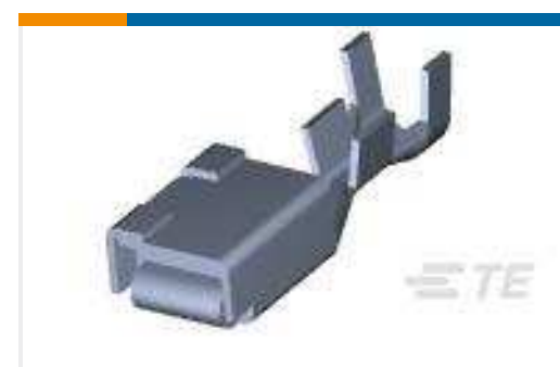
TE Teilenummer316040-2 DYNAMIC D-5 REC CONT. S L/P