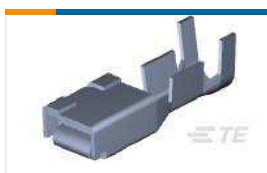
TE Teilenummer316041-2 DYNAMIC D-5 REC CONT. M L/P