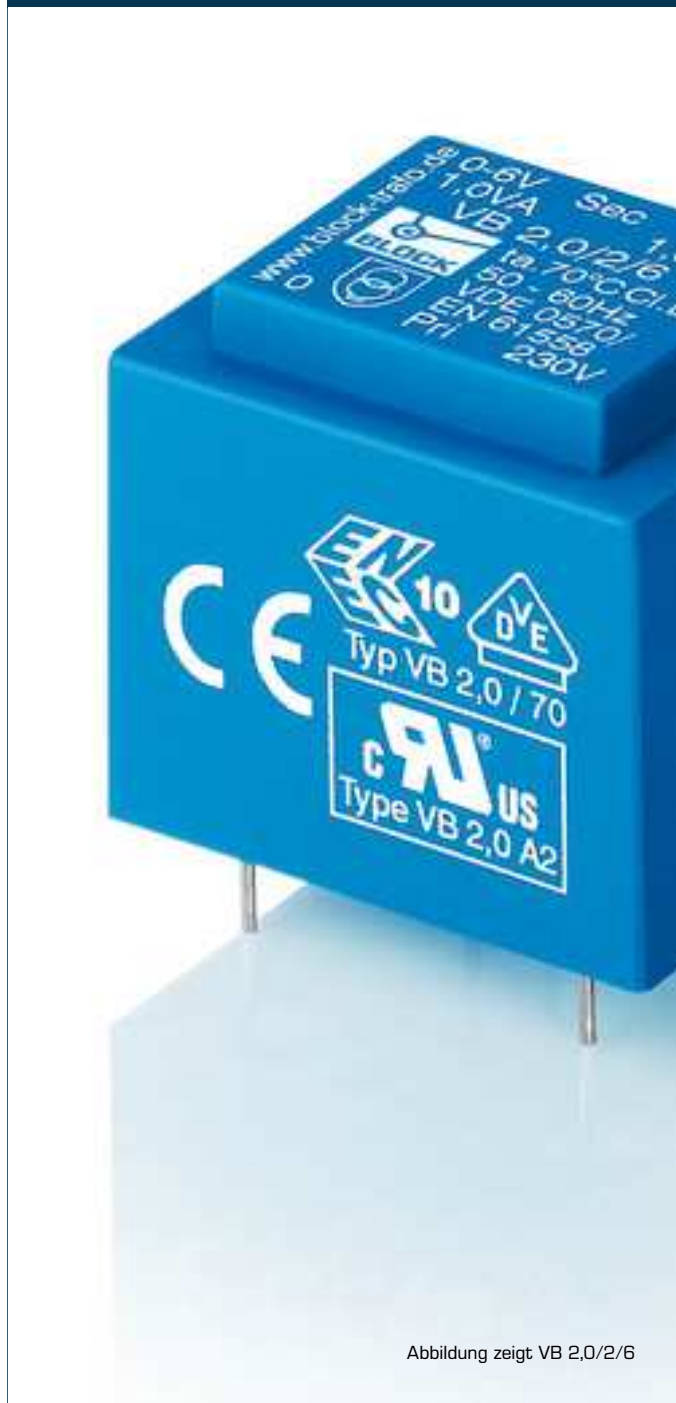
Abbildung zeigt VB 2,0/2/6