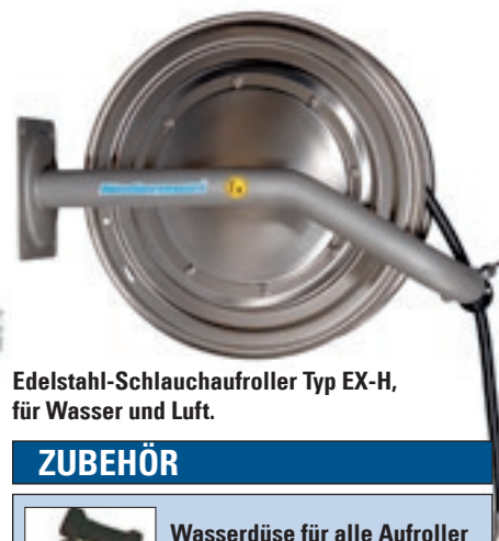
Edelstahl-Schlauchaufroller Typ EX-H, für Wasser und Luft.