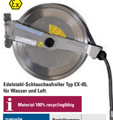
Edelstahl-Schlauchaufroller Typ EX-05, für Wasser und Luft.