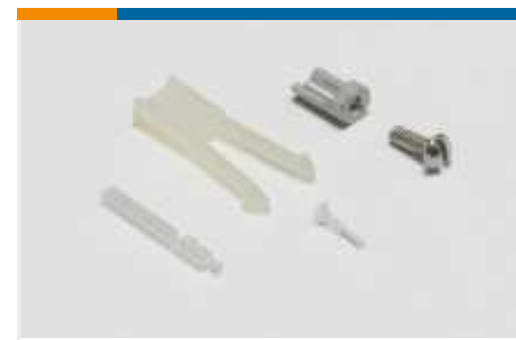
Kodierungen für Leiterplatten- Steckverbinder(1)