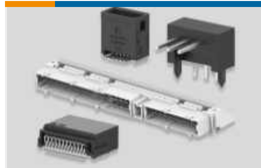
Leiterplattenstiftleisten und -buchsen (283)