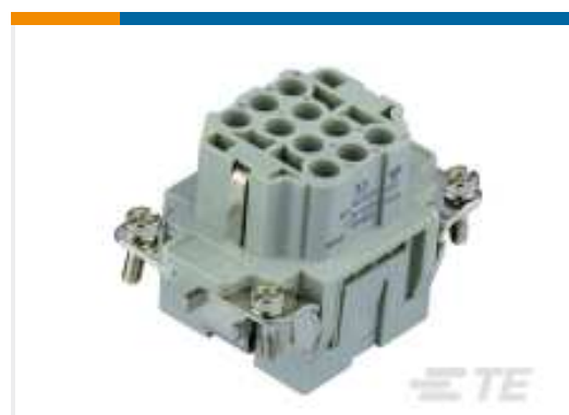
TE Teilnr.:T2050102201-000 HEE-010-F