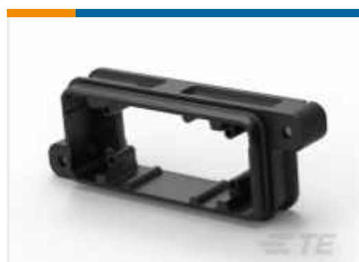
TE Teilnr.:T1930160000-009 H16BPR-AG-EMC-C