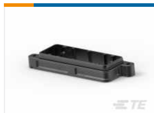
TE Teilnr.:T1930240000-000 H24BPR-AG