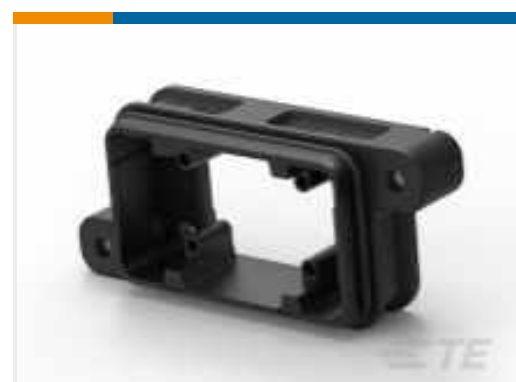
TE Teilnr.:T1930060000-009 H6BPR-AG-EMC-C