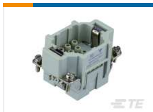
TE Teilnr.:T2050102101-000 HEE-010-M