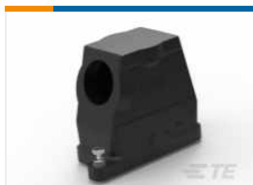
TE Teilnr.:T1910100140-009 H10BPR-TSH-M40-EMC-C