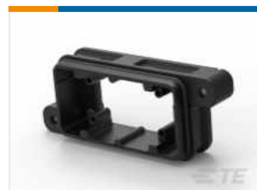
TE Teilnr.:T1930100000-009 H10BPR-AG-EMC-C