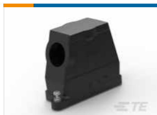
TE Teilnr.:T1910160140-009 H16BPR-TSH-M40-EMC-C