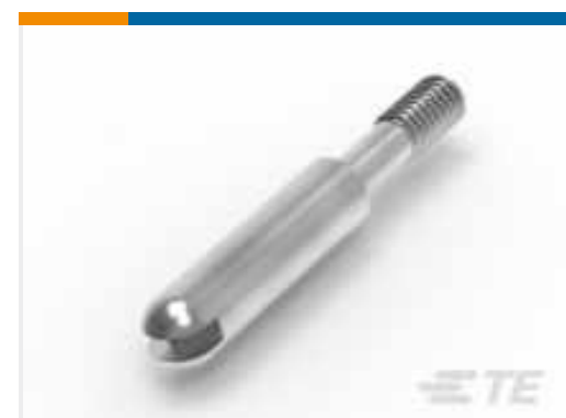
TE Teilnr.:T0931000425-000 CODING-PIN-M3-LTM