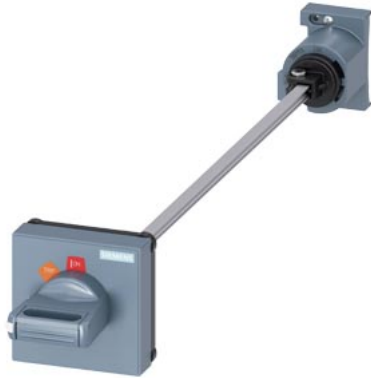
Türkupplungs-Drehantrieb für Leistungsschalter Baugröße S00...S3, schwarz 330 mm Welle