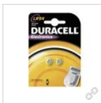
DURACELL LR54 B2 (große Karte)