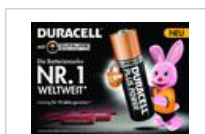
Anzeigenvorlage Duracell 'Die Batteriemarke Nr. 1 Weltweit'