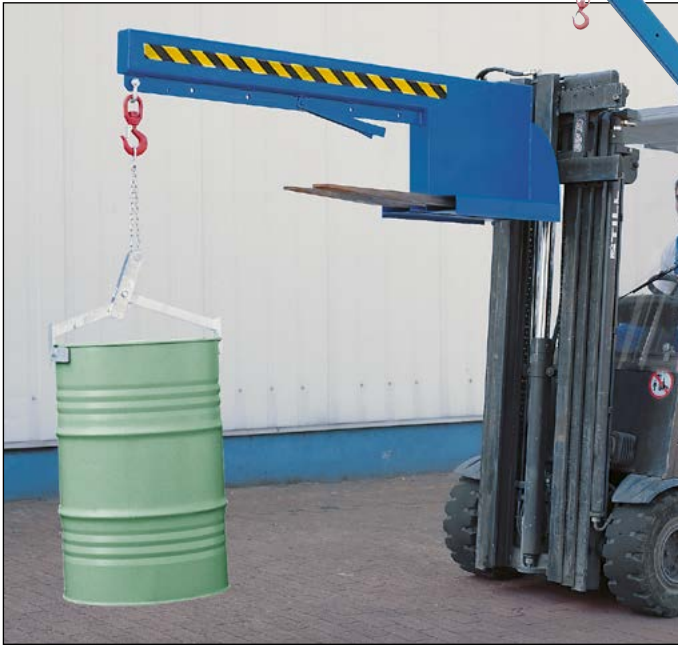
Kranarme Typ KV, ausziehbar und höhenverstellbar, Bestell-Nr. 145-447-J0

Typ KV: 6-fach horizontal ausziehbar und in 5 Teilschritten bis 45° höhenverstellbar Die Kranarme Typen KH und KV sind von 2 bis 3,7 m in der Länge verstellbar.