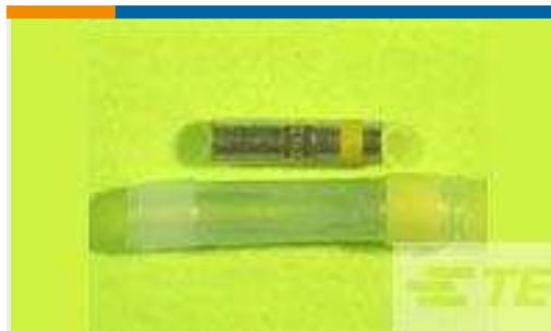
TE Teilnr.:650076-000 D-436-38