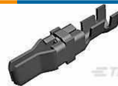
TE Teilnr.:66261-4 MALE CONTACT ASSY. (L.P.)