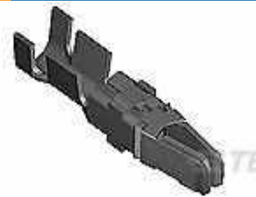
TE Teilnr.:2-66740-1 TYPE XII FEMALE CONT (LP)