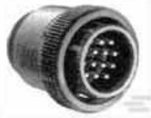
TE Teilnr.:206305-1 CPC PLUG ASSEMBLY SIZE 23-37