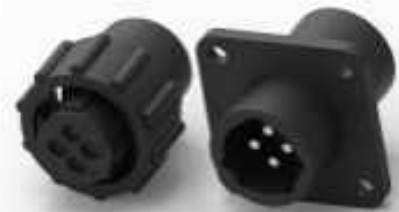
TE Teilnr.:211400-1 Steckverbinder der CPC Serie 1 für die Kabel- oder Panelmontage