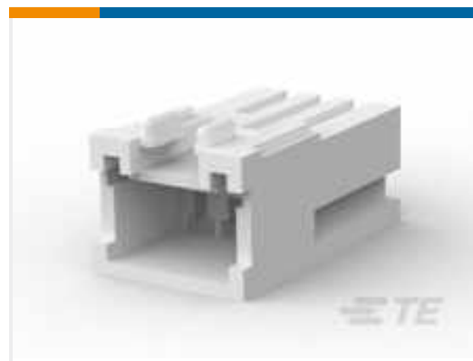
TE Teilnr.:316094-1 STD-Temperatursignal-Double-Lock- Kappe