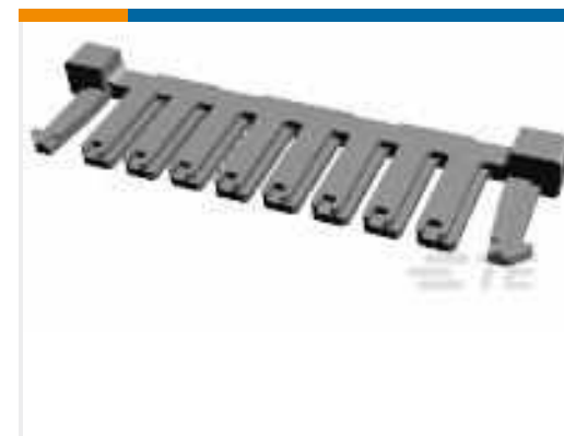
TE Teilnr.:917706-1 2.5 SIGNAL DBL LOCK DLP 10P