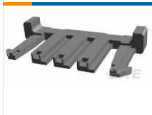
TE Teilnr.:917701-1 2.5 SIGNAL DBL LOCK DLP 5P