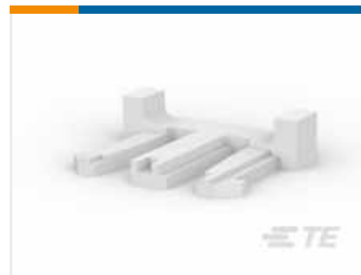
TE Teilnr.:917708-1 Signal-Double-Lock-TPA