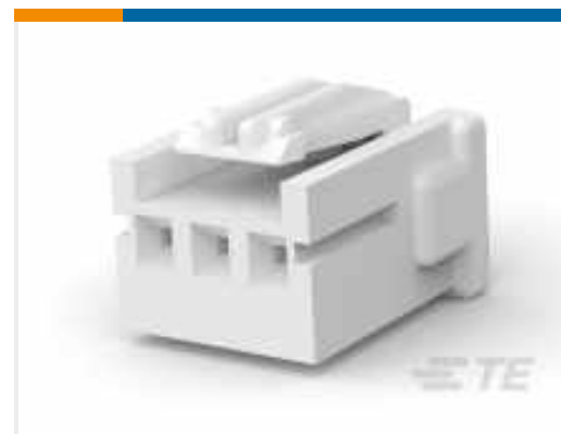
TE Teilnr.:917689-1 STD-Temperatursignal-Double-Lock- Stecker