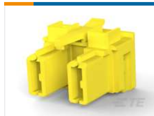
TE Teilnr.:1-1743165-5 250 HSG. PL EX REC. 12mm 2P YELLOW