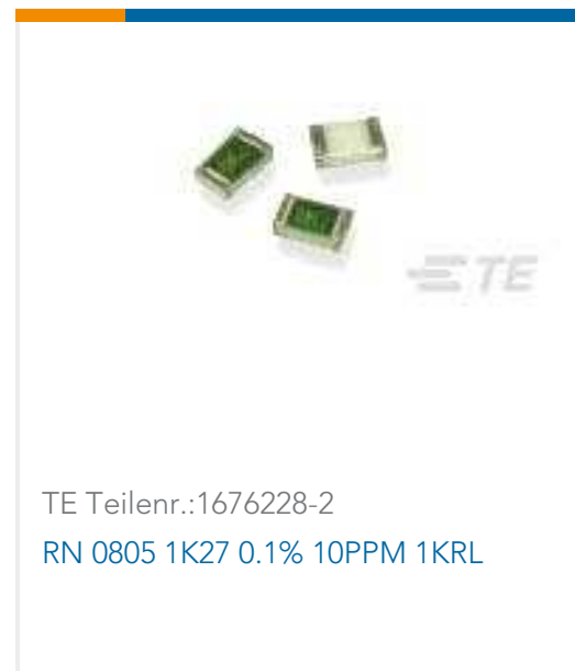
TE Teilnr.:1676228-2 RN 0805 1K27 0.1% 10PPM 1KRL