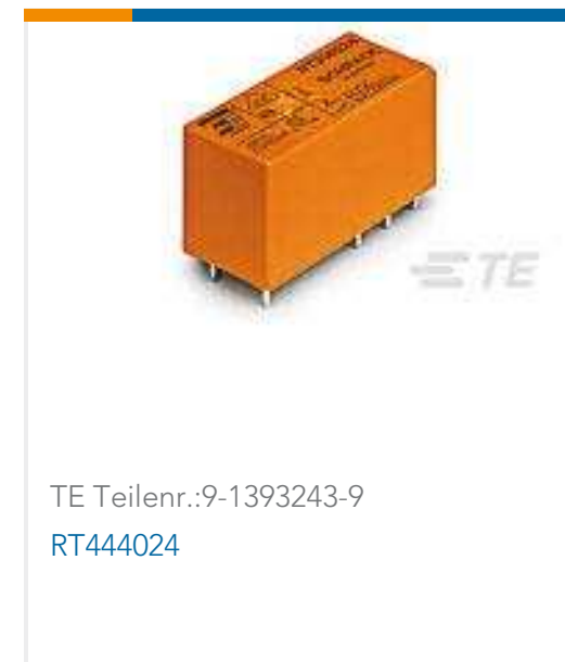
TE Teilnr.:9-1393243-9 RT444024