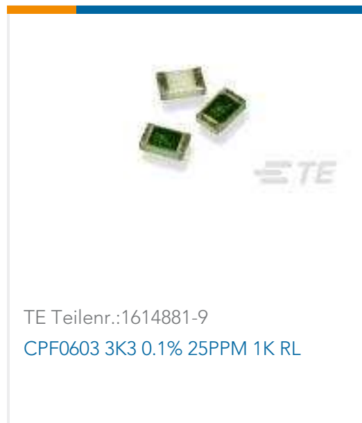
TE Teilnr.:1614881-9 CPF0603 3K3 0.1% 25PPM 1K RL