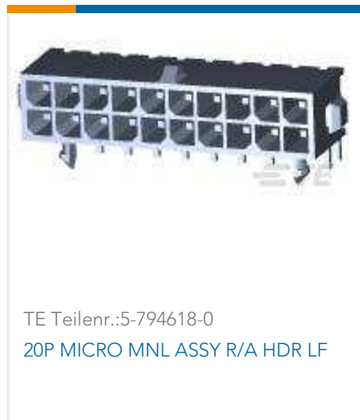
TE Teilnr.:5-794618-0 20P MICRO MNL ASSY R/A HDR LF