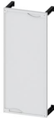
ALPHA 160 DIN Einbausatz Montageplatte Feldabdeckung geschlossen H=600mm, B=250mm