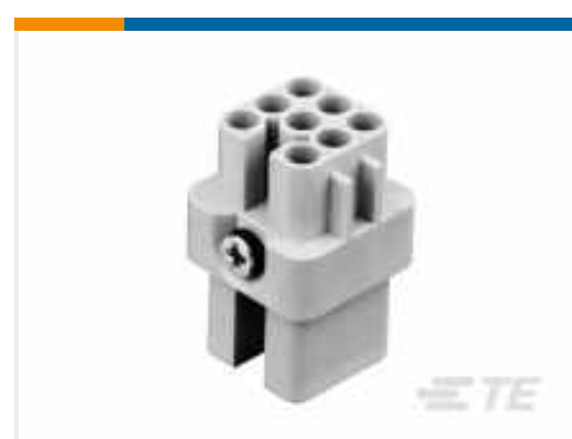
TE Teilnr.: T2020082201-000 HD-008-F