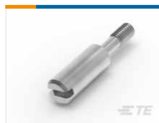
TE Teilnr.: T0931003003-000 CODING-PIN-M3