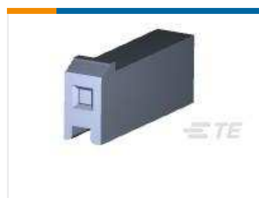
TE Teilnr.: 640250-1 01P SL156 HSG W/LCK RAMP NATL