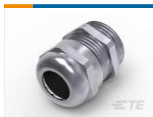
TE Teilnr.: T3609250102-000 DLX-25-M