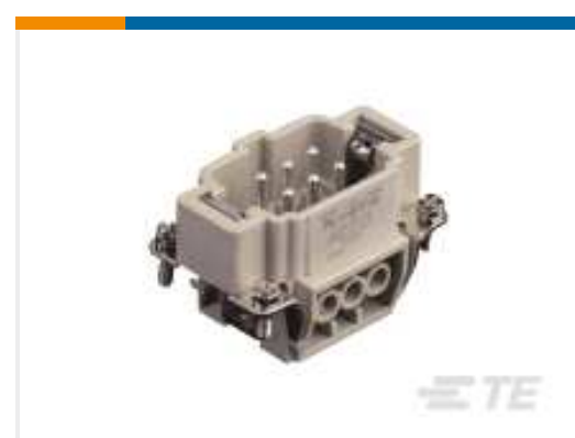
TE Teilnr.: T2040062101-000 HE-006-M