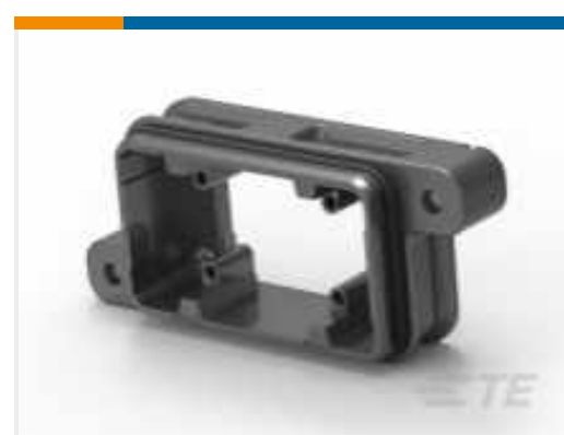
TE Teilnr.: T1930062000-000 H6BPR-AG