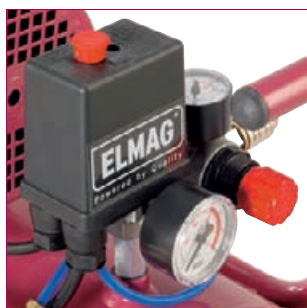
Druckschalter, Manometer und Druckminderventil