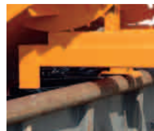
Automatische Entriegelung durch Aufsetzen des Auslösefußes