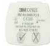
D7925 P2 R