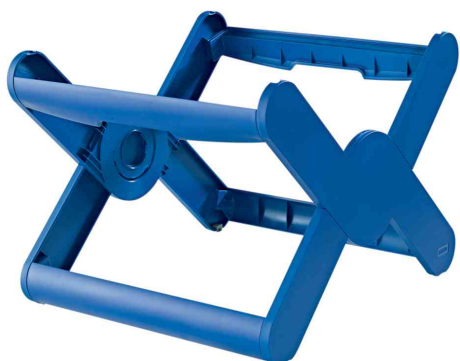
Bac pour dossiers suspendus X-CROSS, bleu