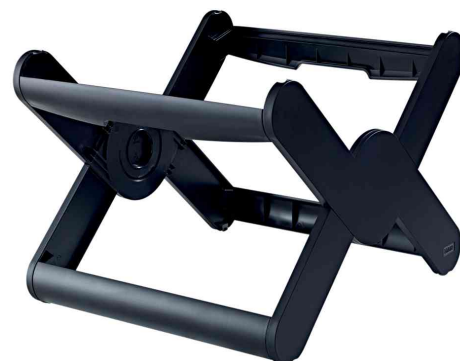
Bac pour dossiers suspendus X-CROSS, noir