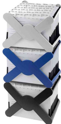
Visuel de référence : présente le produit empilé plusieurs fois