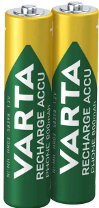
Telefon-Akku "RECHARGE ACCU Phone"

- für analoge und digitale Schnurlostelefone