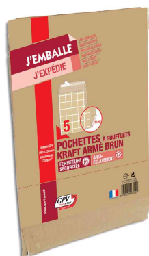
Symbolbid: Faltenversandtaschen fadenverstärkt