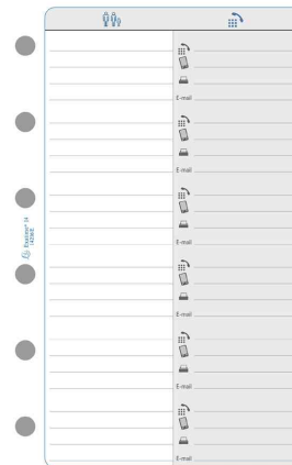
Recharge "Exatime 14", Adresses-Téléphones