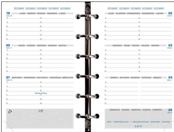
Visuel de référence: Recharge pour organisateur "Exatime 14", 2 pages/semaine