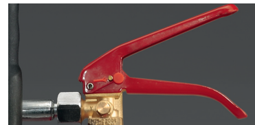
Abb. 1 Schneerohr