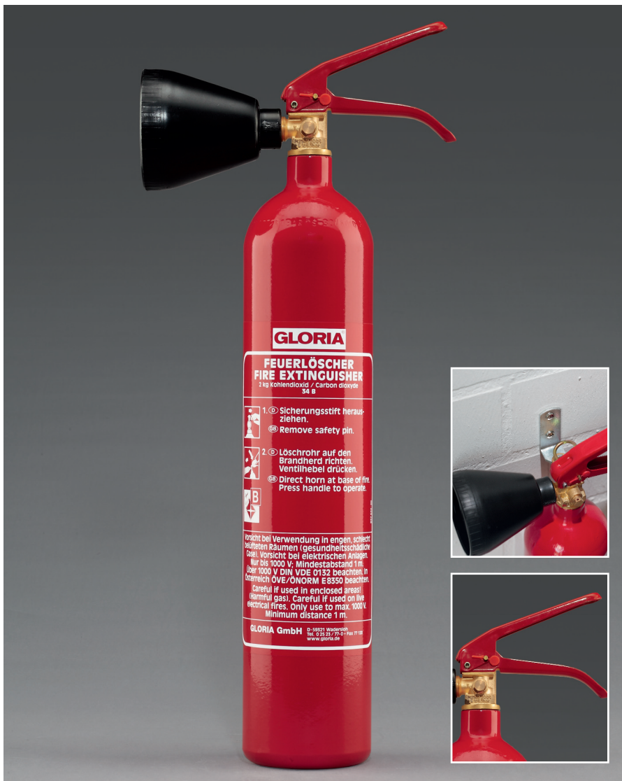
Abb. KS 2 ST