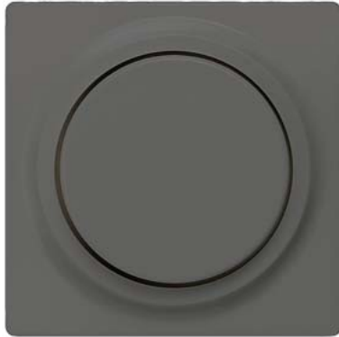
DELTA i-system carbonmetallic Abdeckplatte für Dimmer mit Drehknopf 55x 55mm