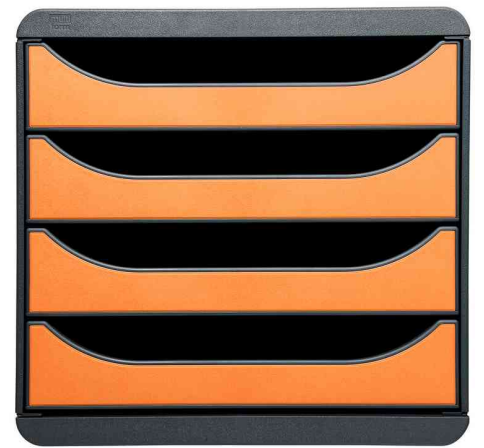
Schubladenbox BIG-BOX, schwarz / mandarine