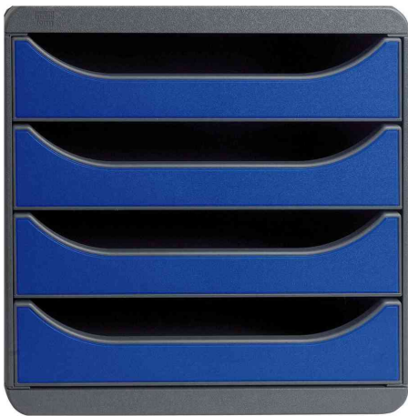
Schubladenbox BIG-BOX, schwarz / königsblau