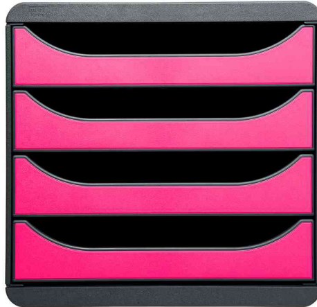
Schubladenbox BIG-BOX, schwarz / himbeer