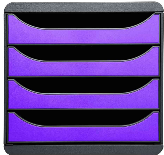
Schubladenbox BIG-BOX, schwarz / violett