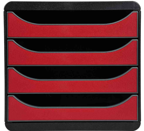
Schubladenbox BIG-BOX, schwarz / karminrot