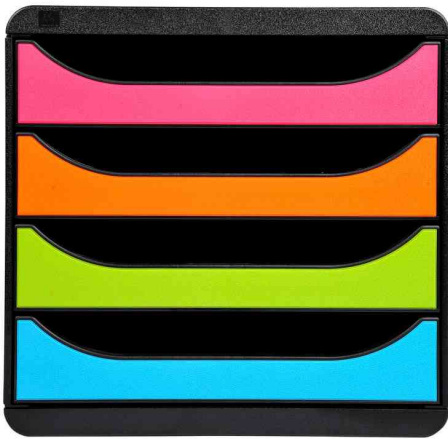
Schubladenbox BIG-BOX, schwarz / harlekin

- für die Ablage von Dokumenten aller Art