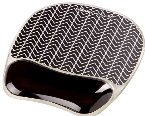
Handgelenkauflage mit Maus Pad Photo Gel