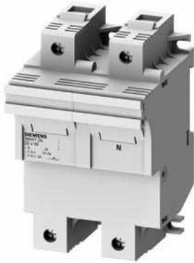
SENTRON, Zylindersicherungshalter, 22x58 mm, 1P+N, In: 100 A, Un AC: 690 V