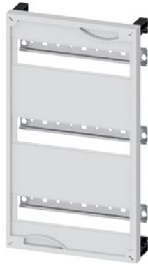
ALPHA 160 DIN Einbausatz Installationseinbaugeräte Reihenabstand 150mm, H=450mm, B=250mm