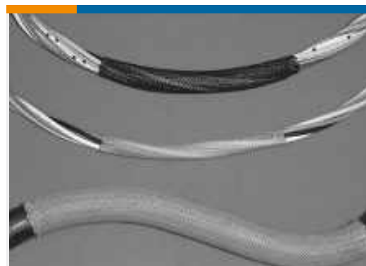
TE Teilnr.:C492924001 VERSAFLEX-30-0-SP