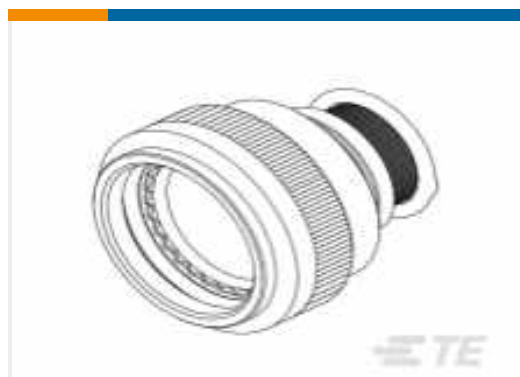
TE Teilnr.:308461-000 TXR54AC00-2210BI