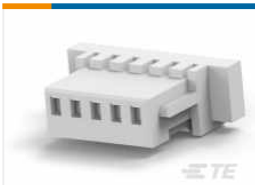
TE Teilnr.:1-1470364-1 AMP HPI 1.0 MM BUCHSENGEHÄUSE