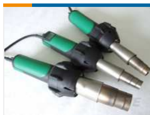
TE Teilnr.: EG1114-000 CV1981-ST-230V1600W-EU