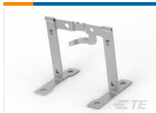
TE Teilnr.:2295891-1 SCREEN CLAMP; MOTORMAN SHROUD