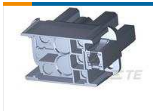
TE Teilnr.:2120320-1 FEMALE INSERT WITH PE-CONTACT