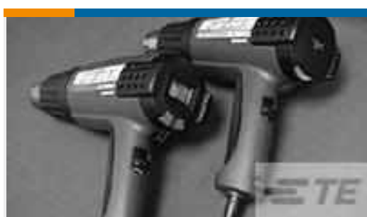
TE Teilnr.: CJ2087-000 HL2010E-KIT-120V