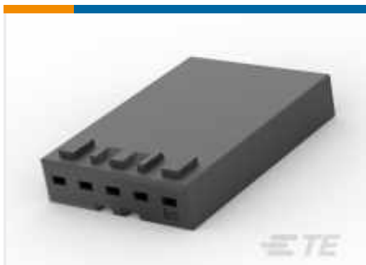
TE Teilnr.:2295894-1 SIGNAL HOUSING