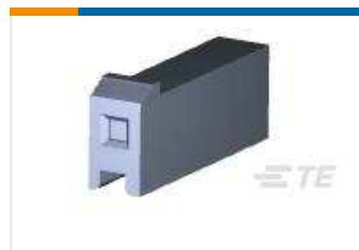
TE Teilnr.:640250-1 01P SL156 HSG W/LCK RAMP NATL