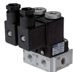
Beispiel verkettete Ventile

i Diese Ventile werden grundsätzlich mit Spule und Stecker ausgeliefert!