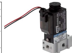
mit Rechteckstecker SY100

i Diese Ventile werden grundsätzlich mit Spule und Stecker ausgeliefert!