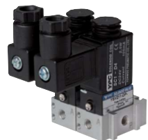
Beispiel verkettete Ventile

i Diese Ventile werden grundsätzlich mit Spule und Stecker ausgeliefert!