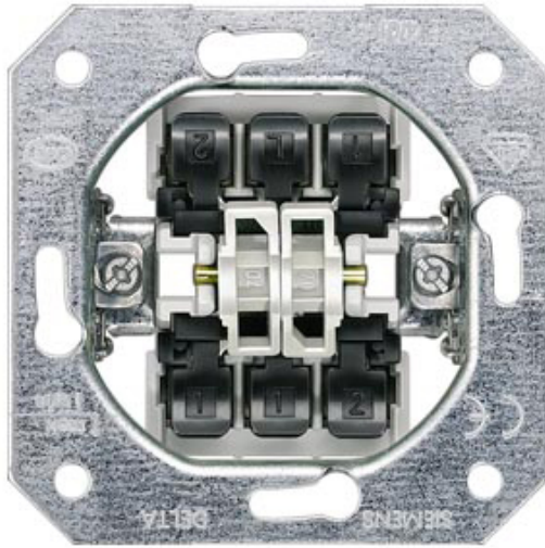
DELTA SCHALTER-GERAETEEINSATZ UP, DOPPEL-WECHSELSCHALTER 10A 250V