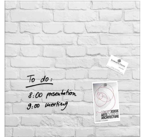
Glas-Magnettafel "artverum" Design, White-Klinker